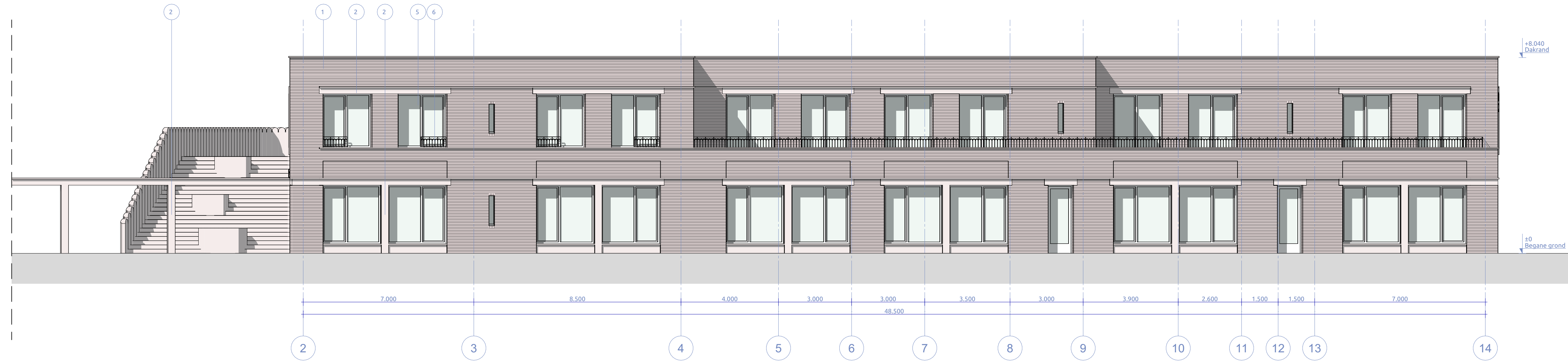
Voorgevel loodrecht stramien